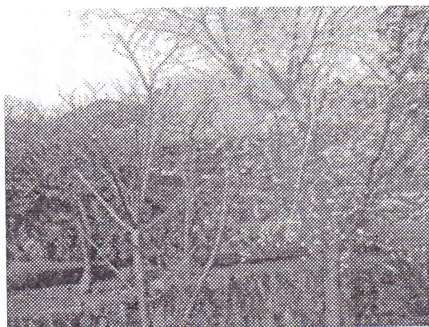
春の訪れ (境内の河津桜)